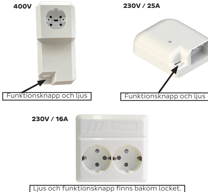
Bild av reläboxar